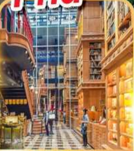
ร้านไอศกรีมมียาฮาร์