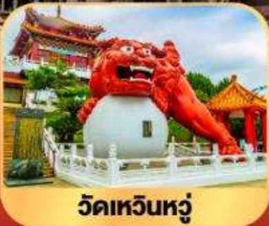
วัดเหวินหลู่