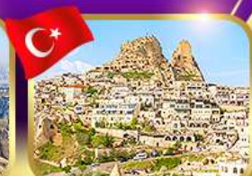
หุบเขาอูชิซาร์ คัปปาโดเกีย