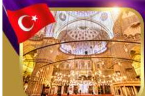
เข้าชมความงามสุเหร่าสีน้ำเงิน