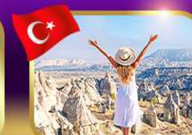
ชมความงาม หุบเขาแห่งรัก