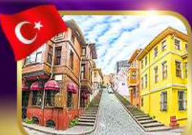
ชมบ้านหลากสีย่านบาลีก