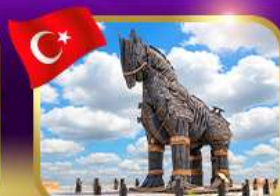
ม้าไม้เมืองทรอย ซานิคคาล