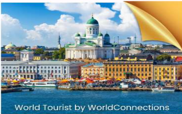
World Tourist by WorldConnections