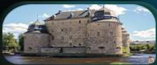
ปราสาทโอเรโบ