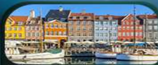
ย่านนูซาวน์