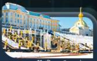
พระราชวังปีเตอร์ฮอฟ