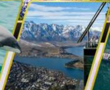
ยอดเขานีออนส์พิค