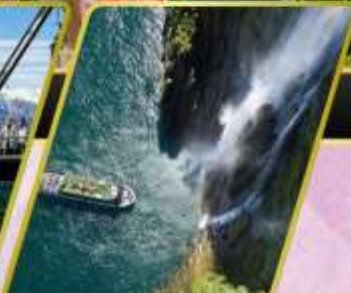
ล่องเรือมิลฟอร์ด ซาวน์