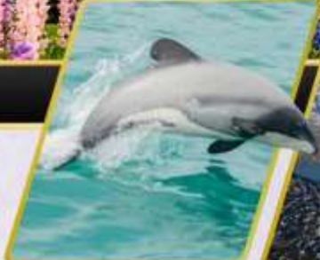
ล่องเรือชมปลาโลมา