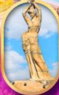
เด็กหญิงชาวประมง