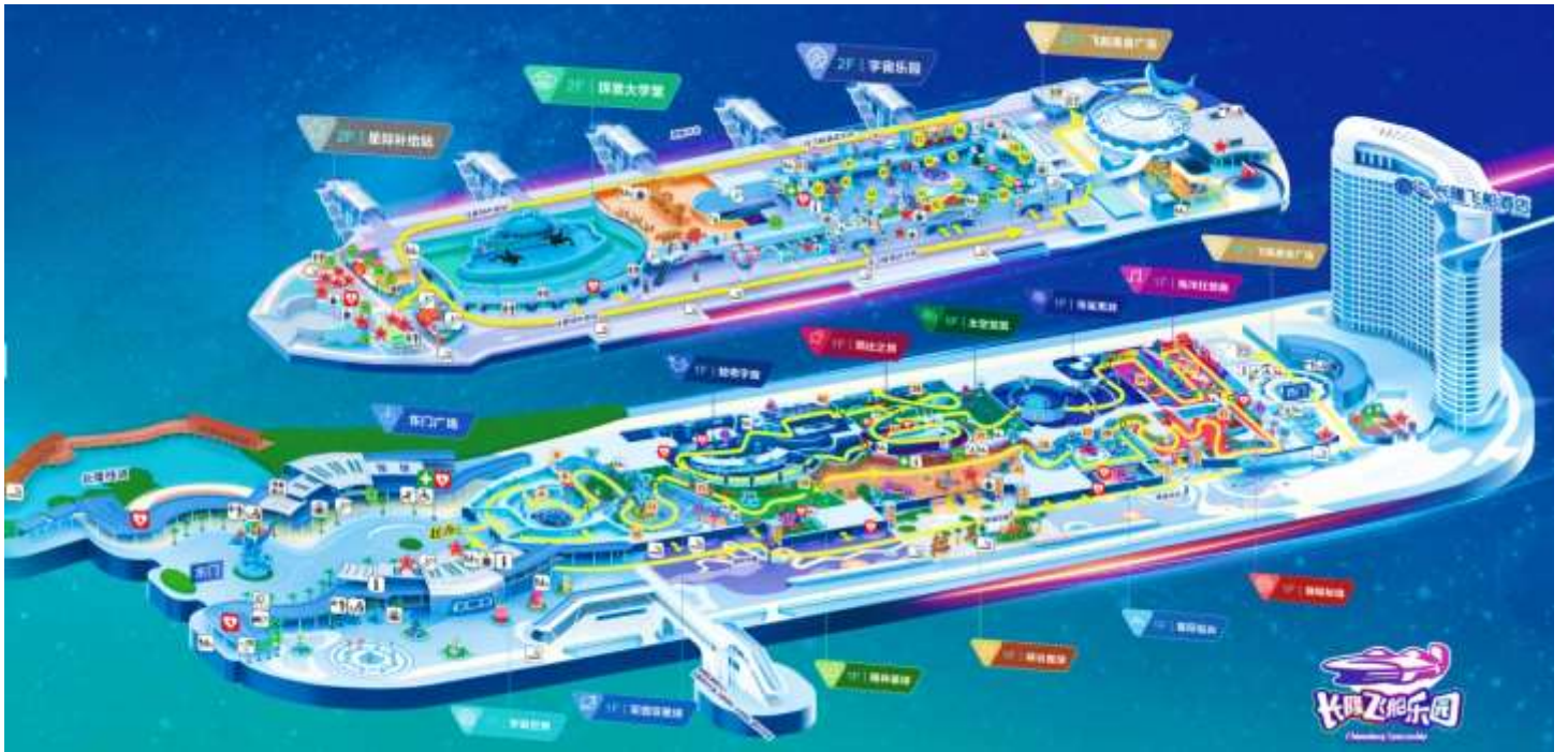
แผนที่ CHIMELONG SPACESHIP PARK