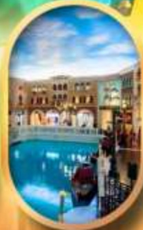
เดอะเวนิเซียน