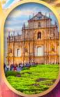
โบสถ์เซนต์พอล