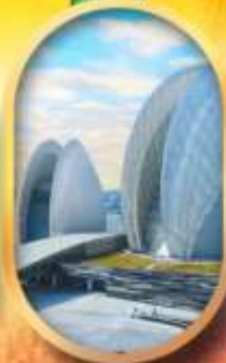
โรงละครโหลต