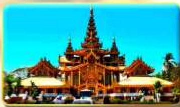
พระราชวังบุเรงนอง