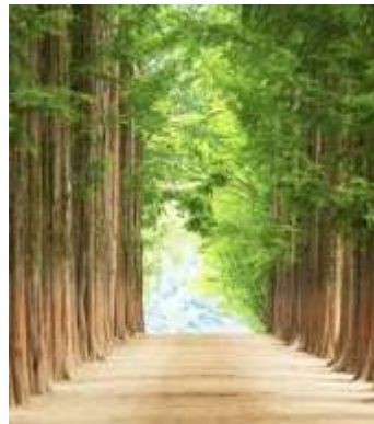
เรื่อง Winter Love Song

06.20-08.40 น. เดินทางถึงสนามบินนานาชาติอินชอน (หรือเทียบเท่า) เป็น สนามบินที่ทันสมัย สะอาด ปลอดภัย และได้รับมาตรฐานระดับโลก ท่านจะต้องผ่าน ด่านควบคุมโรค และด่านตรวจคนเข้าเมือง หลังจากนั้นออกมาพบกับมัคคุเทศก์นำ เที่ยวยังจุดนัดพบ เพื่อออกเดินทางท่องเที่ยว