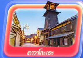
คาวาโกะเอะ