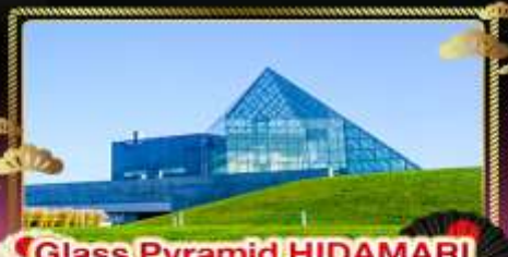
• Glass Pyramid HIDAMARI