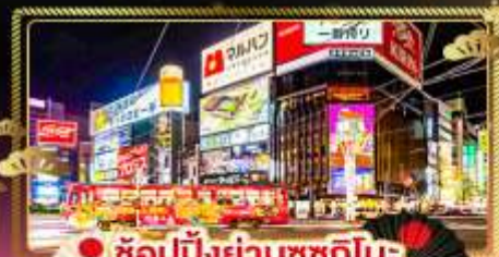
• ช้อปปิ้งย่านซุกุโกโบ