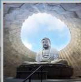
"HILL OF BUDDHA"