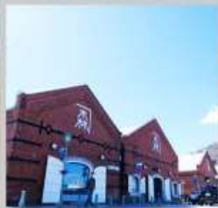
"KANEMORI RED BRICK"