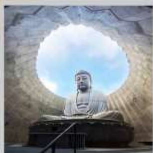
"HILL OF BUDDHA"