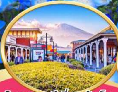
โตเกียว: พรีเมียมเอ้าเล็ต