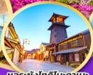
หอระฆังโทคิโนะคานะ