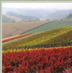
"SHIKISAI NO OKA"