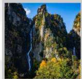
“GINGA & RYUSEI FALLS”

สัมผัสความสวยงามของดอกไม้ “ดอกทิวลิป ณ สวนคะมิยูเบตสึ” ที่มีมากกว่า 120 สายพันธุ์ เพลิดเพลินกับ “ถ้ำน้ำแข็งไอซ์ พาวีเลียน” ที่มีหยดน้ำแข็งรูปร่างสวยงามต่างๆ ที่อุณหภูมิ -20 องศา “ฟาร์มสุนัขจิ้งจอกฮอกไกโด” ฟาร์มสุนัขจิ้งจอกแห่งเดียวของเกาะฮอกไกโด สายพันธุ์ท้องถิ่นคือ สายพันธุ์ Ezo red fox ชมกระท่อมไม้หลังน้อยในดินแดนเทพนิยาย ณ “หมู่บ้านนิงเกิลเทอร์เรซ” จำหน่ายสินค้าจำพวกงานฝีมือต่างๆ นำท่านขึ้นชมวิวมุมสูง “นั่งกระเช้าภูเขาไฟโมอิวะ” เพื่อชมทัศนียภาพของเมืองซัปโปโรจากมุมสูง ชม “ทุ่งดอกพืชมอส ณ สวนทาคิโนะอุเอะ” ด้วยพรมสีเขียวที่มีพื้นที่ขนาดใหญ่ถึง 100,000 ตารางเมตร