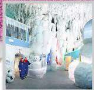
“KAMIKAWA ICE PAVILLION”