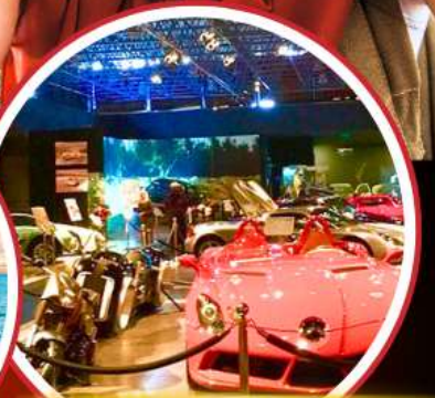
Royal Automobile Museum