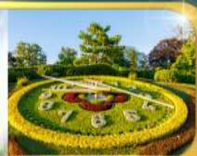
นาฬิกาดอกไม้เมืองเจนีวา

เดินทาง 9 วัน 6 คืน 09-17 ก.พ.69 22-30 มี.ย.69