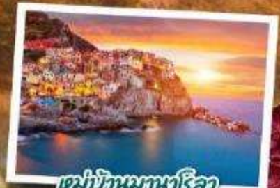
หมู่บ้านมหานาคีลา