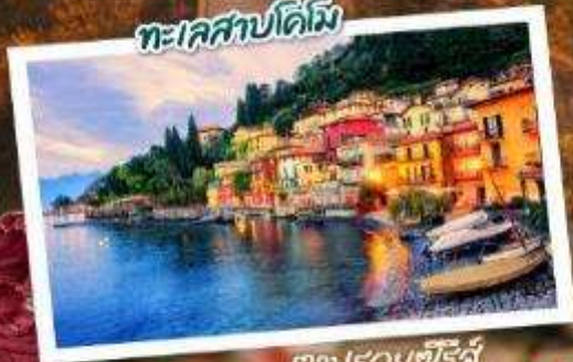
ตามรอยซีรีส์