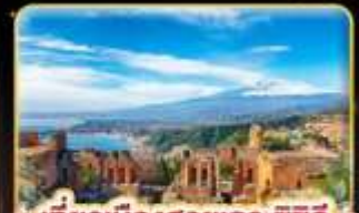
เที่ยวเมืองสวยเกาะซิซิลี Taormina