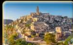
ตามรอย 007 เมือง Matera