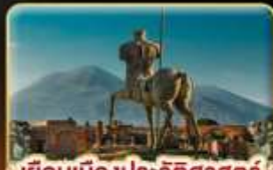
เยือนเมืองประวัติศาสตร์ ปอมเปอี