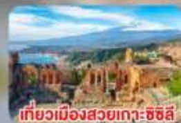
เที่ยวเมืองสวยเกาะซิซิลี Taormina