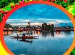
ล่องเรือทะเลสาบตาดาล