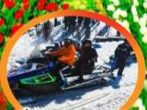
ขี่ SNOW MOBILE