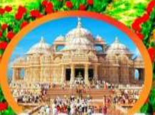
วิหารอินดูอัชมาตัม