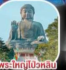
พระใหญ่ไผ่หวิน