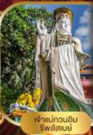
เจ้าแม่กวนอิม ริฟลิสซีย์