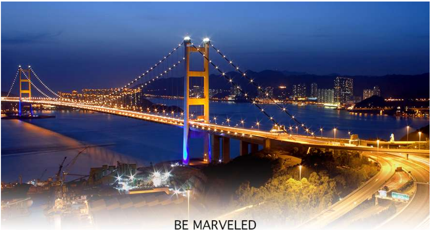
BE MARVELED สะพานแขวนฉิวหม่า