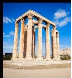
Temple Of Olympian