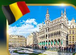
จัตุรัสกรอนด์ ปลาซ บริซเซลส์