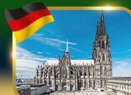
มหาวิหารแห่งเมืองโคโลญ