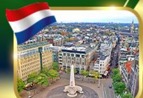
จัตุรัสดันสแควร์ ฮัมสเตอร์ดัม