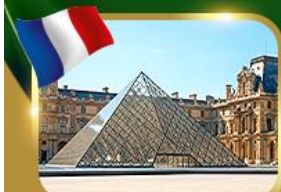
พีระมิดที่ลูฟวร์ ปารีส