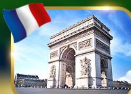
ประตูชัยฝรั่งเศส ปารีส