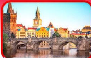
เขื่อนอินสะพานชาร์ลส์