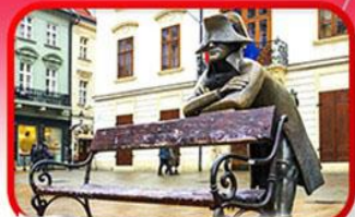
ย่านเมืองเก่าปราทิสลาวา

เที่ยวเมืองสวยริมทะเลสาบ ฮัลล์สตัดท์ • ชมเมืองไข่มุกแห่งโบฮีเมีย เซสกี กรุงลอน • ปราก • เวียนนา • ซอปปิงพาร์นดอร์ฟ เอาก์เล็ท