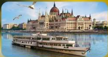
ล่องเรือแม่น้ำดานูบ พร้อมจิบแชมเปญ