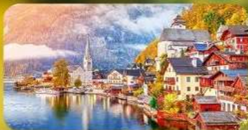
การ์นต์พัก Hallstatt / St. Wolfgang หรือริมทะเลสาบ 1 คืน