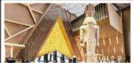
พิพิธภัณฑ์แกรนด์อียิปต์(GEM)

อารยธรรมลุ่มแม่น้ำไนล์ - พีรามิด - อเล็กซานเดรีย - แมมฟิส - ไคโร - โรงแรมระดับ 4 ดาว รวมค่าตั๋วเครื่องบิน - ค่ารถเช่า - ค่าเข้าชม - ค่าอาหารครบทุกมื้อ