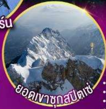
ยอดเขาชุกสปีตเซ