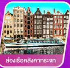
ส่องเรือสิงคารถะจก

เที่ยวเทศกาลดอกไม้เคอเคนฮอฟ ชมแคว้นอาลซัส หมู่บ้านสวยที่สุดในฝรั่งเศส เยือนเมืองมรดกโลก