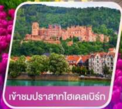
เข้าชมปราสาทไฮเคลมเบิร์ก