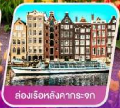
ล่องเรือหลังคากระຈก