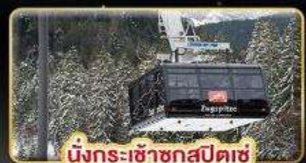
นั่งกระเช้าซุกสปีดเซ่