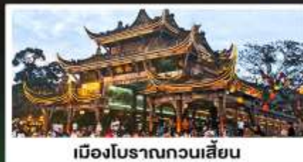
เมืองโบราณกวนเสียน