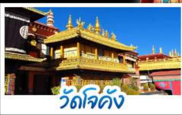
วัดโจคัง