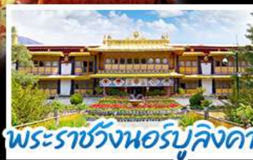
พระราชวังนอร์บูลิงคา