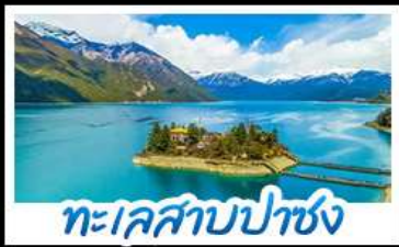
ทะเลสาบปาซง