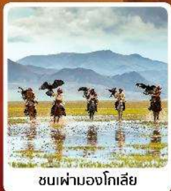
ชมเฟ้ามองโกเลีย