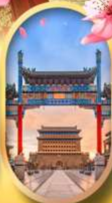
ถนนคนเดินเจียมเหมิน