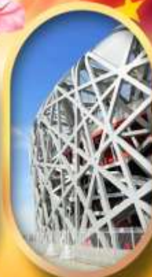
ผ่านชมสนามกีฬาโอลิมปิก