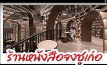
ร้านหนังสือจุกเกอ

อุทยานภูทาสัตว์ดุริย อุทยานป่านิงโกว หนีแพนด้าออนเซฟ ร้านหนังสือจุกเกอ วัดต้าฉือ ถนนโบราณความจำ ซอปปิงย่านคิง ถนนไท่กุ่หฺสึ + ถนนชุนซีตู้ เมนูพิเศษ สุกี้หมาล่าเสอวน