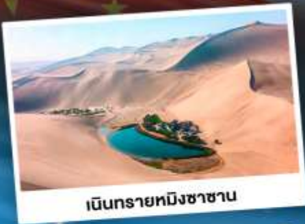
เนินทรายหมีซาซาน