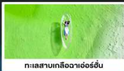
ทะเลสาบเกลือดาเอ๋อร์อัน