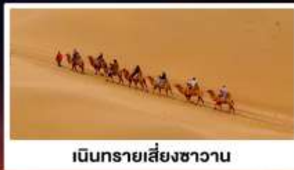
เนินทรายเสี่ยงชาวน