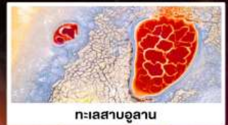
ทะเลสาบอูแลกัน