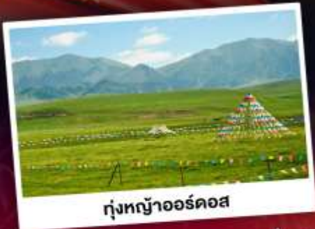
ทุ่งหญ้าออร์ดอส