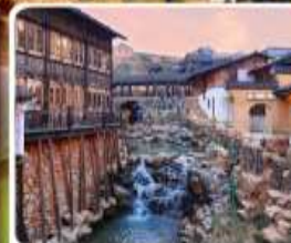
เมืองโบราณเหย้าหู