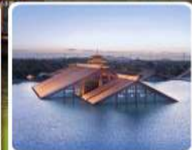
พิพิธภัณฑ์ไดน้ำ กวางฟู่หลิน