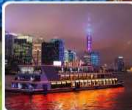
ส่องเรือแม่น้ำหวงผู่