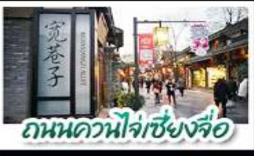
ร้านหนังสือจงซูเก้อ