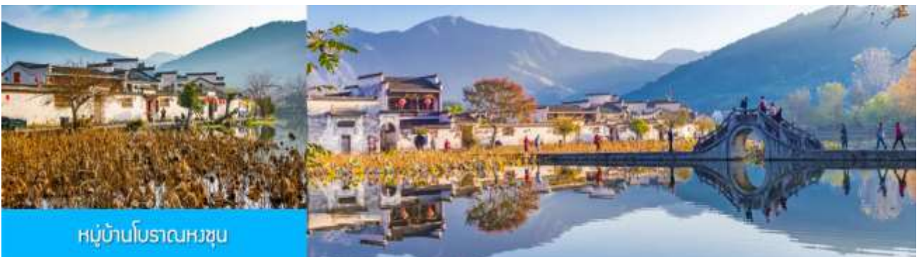
หมู่บ้านโบราณหงซุช

ไกด์ท้องถิ่นนำเสนอโปรแกรมทัวร์เสริมบัตรชมการแสดงชุด ตำนานรักเมืองซ่ง 宋城千古情 การแสดงภายในโรงละครที่ดีที่สุด และได้รับรางวัลมากที่สุดของประเทศจีน.....อัตราค่าบริการสำหรับโปรแกรมเสริม ท่านละ 380 หยวนหรือ 1,900 บาท ใช้เวลาประมาณ 90 นาที ค่าบริการรวม ค่าตัวชมการแสดง ค่ารถบัสรับ และค่าน้ำที่วิวของไกด์ท้องถิ่น