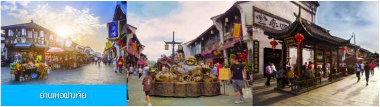
ย่านหอฝางเจีย