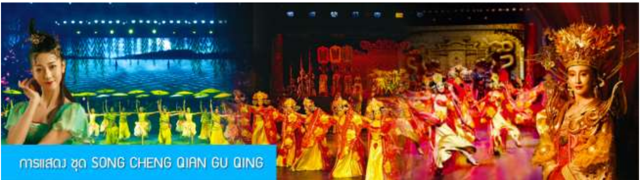
การแสดง ชุด SONG CHENG QIAN GU QING

พักที่ โรงแรม VIENNA HOTEL หรือเทียบเท่าในเมืองหังโจว