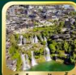
"เมืองโบราณฟูหลงเจิน"