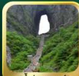
"กำประตูลิ่ว"