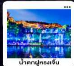
น้ำตกฟูหลงเจิน

"มหัศจรรย์...จางเจียเจีย" | ดินแดนแห่งขุนเขาและสายน้ำ "เขาเทียนเหมินซาน" | ประตูล่องเรือ...ทำทนายศรึกษา 999 ชั้น | บั้งรถไฟความเร็วสูง สัมผัสความสวยงามระเบียงแก้ว "อุทยานอวตาร" | ส่องล่องกลางขุนเขา...ดั่งภาพฝันในห้วงนเจียเจีย | ซุปปัง POPMART "เมืองโบราณ"ฟูหลง" หยุตเวลา ณ เมืองบนบ้านน้ำตก... | "เฟิ่งหวง" ส่องเรือชมชีวิตริมแม่น้ำถิวเจียง "นครฉางซา" ปิดท้ายความทันสมัย