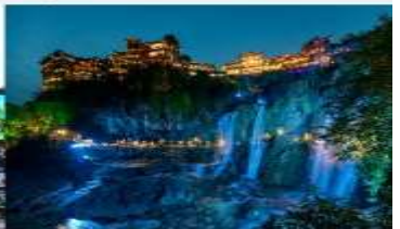
ฟูหรงเจิน

*ทางบริษัทฯ ขอสงวนสิทธิ์ในการสลับโปรแกรมทัวร์ตามความเหมาะสมขึ้นอยู่กับสถานการณ์หน้างาน โดยคำนึงถึงผลประโยชน์ของลูกค้าเป็นสำคัญ