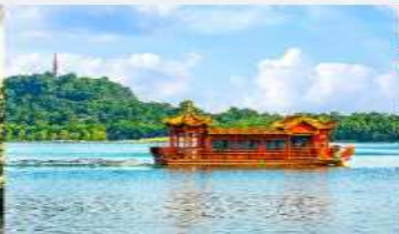
ล่องเรือทะเลสาบหลิวเยว่หู