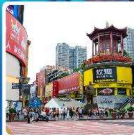
ถนนหวงซิงลู่