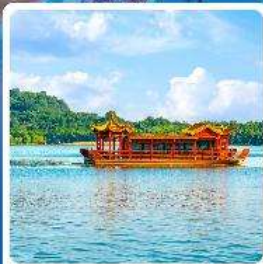
ล่องเรือทะเลสาบหลิวยวู่