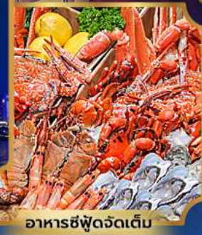
อาหารซีฟู้ดจัดเต็ม

บุฟเฟ่ต์เบียร์ไม่อื่น + ซีฟู้ด + ปิ้งย่างเกาหลี