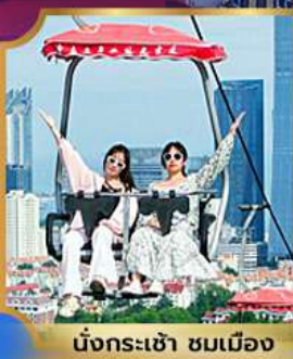
นั่งกระเช้า ชมเมือง