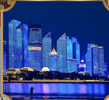
หาดโซเบอร์ฟังก์