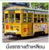
นั่งรถรางต้าเหลียน