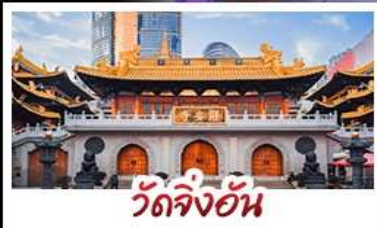
วัดจิ่งอัน