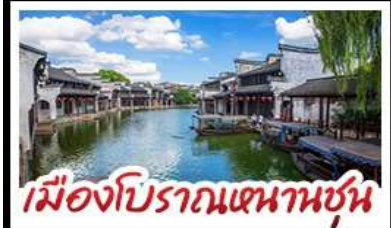
เมืองโบราณหนานชุน

DISNEYLAND SHANGHAI เต็มวัน เมืองโบราณหนานชุน (รวมล่องเรือ) - วัดจิ่งอัน เมืองโบราณหนานชุน - ตลาดร้อยปีฉิงหวังเมี่ยว มือพิเศษ บุฟเฟ่ต์ BBQ, เสี่ยวหลงเปา