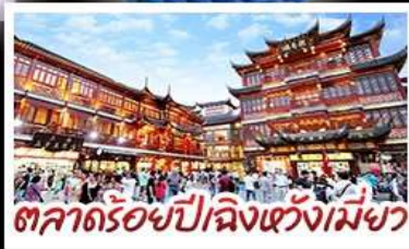
ตลาดร้อยปีฉิงหวังเมี่ยว