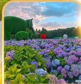
ดอกไม้ตามฤดูกาล